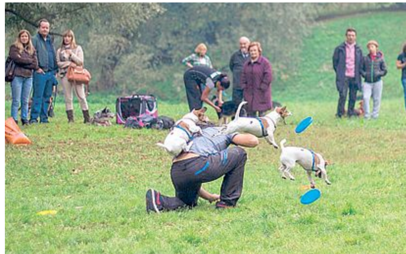
DIVERTIMENTO Momenti felici fra cani e padroni al Parco Lambro